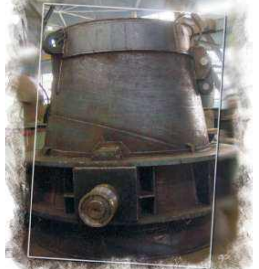
Ковш для ферросилиция