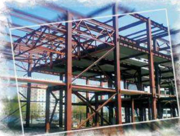
Физкультурный комплекс гуманитарного института