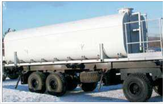
Емкость долива V=25\text{м}^3