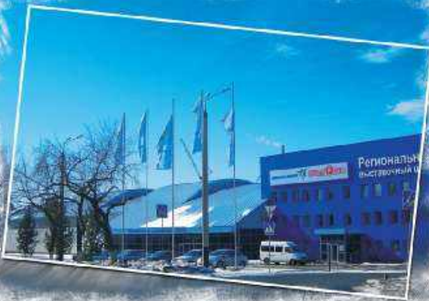
Региональный выставочный комплекс