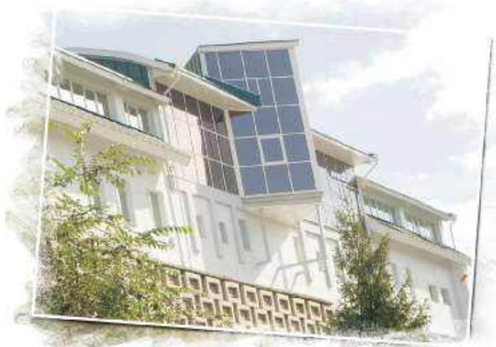
Надстрой офисного здания