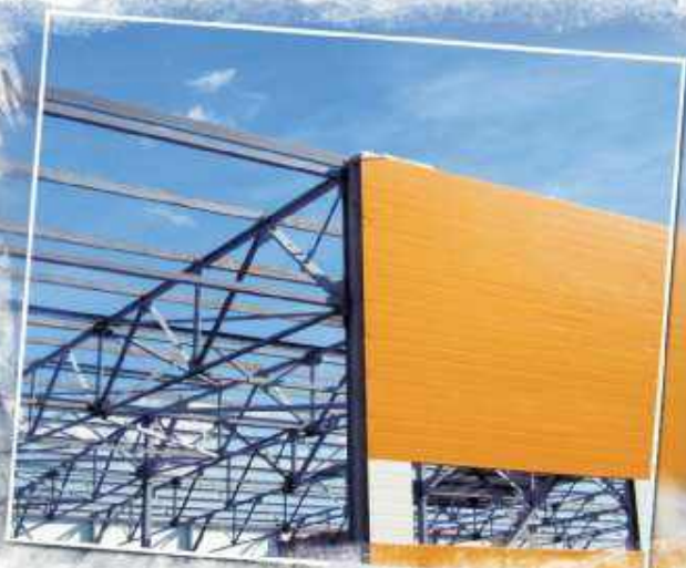
Здание мебельной фабрики