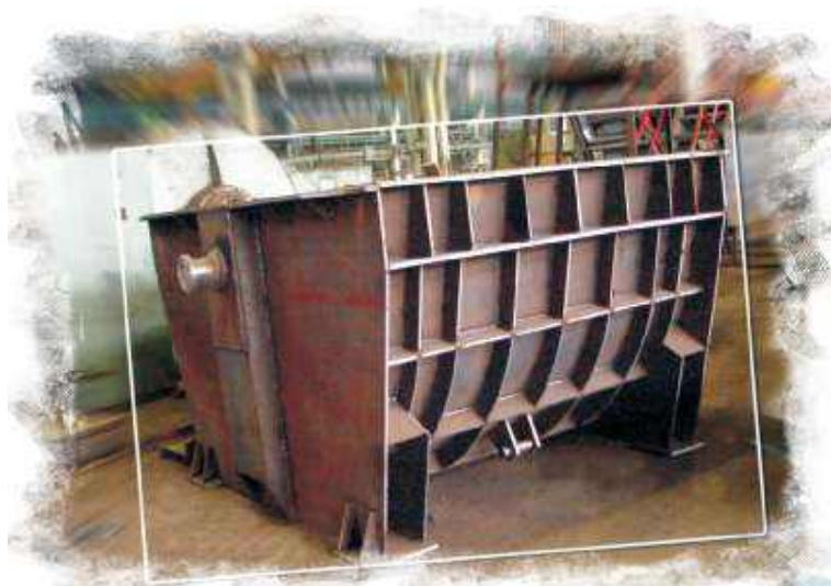
Короб под ферросилиций